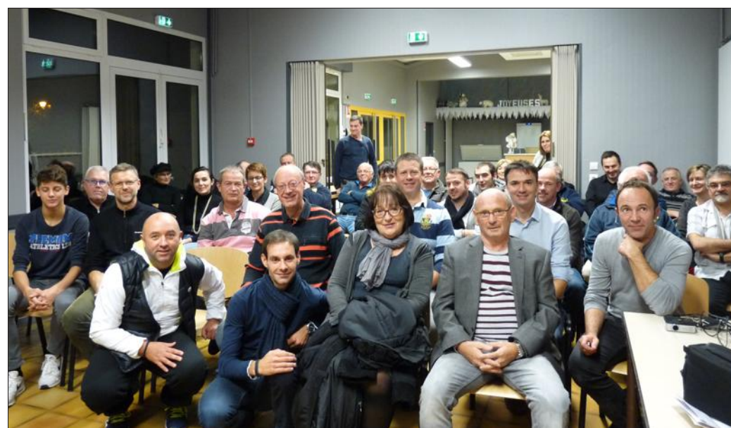
L'assistance a été attentive au déroulement de cette assemblée générale.

Le Tennis-club est monté en puissance dans le domaine de la compétition. Le championnat de Moselle hiver a eu lieu de janvier à mars où une équipe féminine et deux équipes masculines ont été engagées. Le