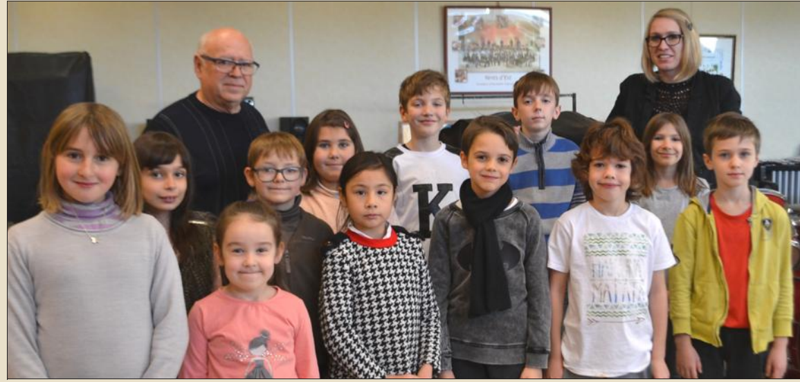
En marge du chant, les enfants s'adonnent à la pratique d'un instrument de musique ou à la danse.