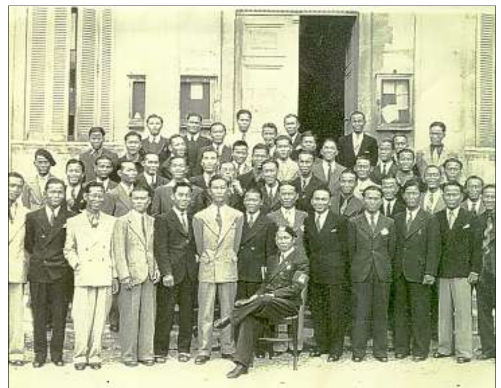
L'expo s'intitule "Indochinois de Provence, le silence de la rizière".

Le pôle culturel Camille-Claudé a participé à l'hommage rendu aux travailleurs indochinois à travers une exposition qui se tiendra jusqu'au 29 septembre.