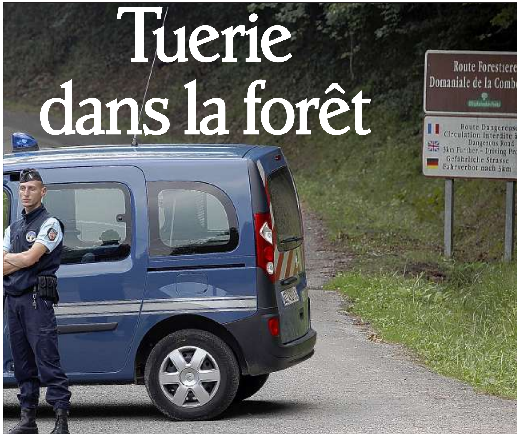
Les enquêteurs ont rapidement bouclé l'accès à la scène du crime. Hier soir, alors que les spécialistes recueillaient des indices, le mystère restait entier sur les circonstances du drame.

C'est un promeneur qui a fait la macabre découverte. Les cadavres de quatre personnes, tuées par balles, ont été retrouvés hier après-midi sur un parking forestier près de Chevaline, en Haute-Savoie. Trois des victimes, un homme et deux femmes, étaient dans une voiture britannique. Un cycliste a été découvert mort à côté. Une fillette gisait aussi non loin, grièvement blessée.