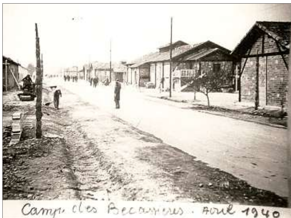
Les Indochinois se voient parquer dans un camp dans le quartier Bécassière de Sorgues.

Ils se voient parquer dans un camp, dans le quartier Bécassière de Sorgues. La plupart resteront bloqués en France après la guerre et