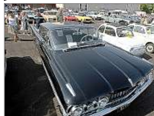
Ce week-end, 5000 personnes devraient venir visiter le salon "auto moto rétro", à Châteaublanc.