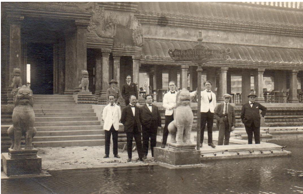
Carte postale de l'Indochine vers 1920.